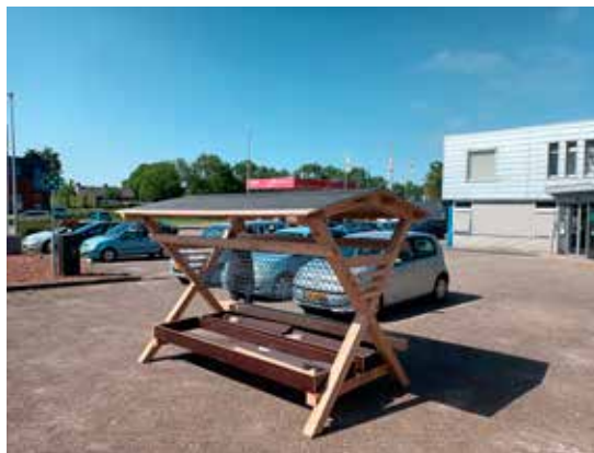
Ruif gemaakt voor het hertenkamp Menkemborg in Uithuizen

De totale opbrengst van het Boekwinkeltje was dit jaar €569,55, waarvan €268,75 naar het goede doel Make a Wish Nederland is gegaan. Dit was de opbrengst van de boekenmarkt. Van Pasen (2022) tot Pasen (2023) is er actie gevoerd voor Spieren voor Spieren. Voor dit goede doel hebben door het organiseren van vele activiteiten een cheque kunnen overhandigen van € 3000,-. Een resultaat om trots op te zijn!