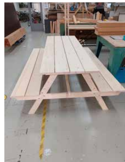
Picknickbanken voor bij de noodwoningen Uithuizen en Zandeweer.

Op iedere afdeling is veel werk verzet. Het werk zelf is niet persé het doel, maar vaak een instrument. Voor persoonlijke ontwikkeling op veel terreinen. Denk dan bijvoorbeeld aan het oefenen van werknemersvaardigheden of het opdoen van contacten, het ontdekken van talenten of het verkrijgen van meer zelfvertrouwen. De prachtige producten die het resultaat zijn van het leerproces dragen daaraan bij.